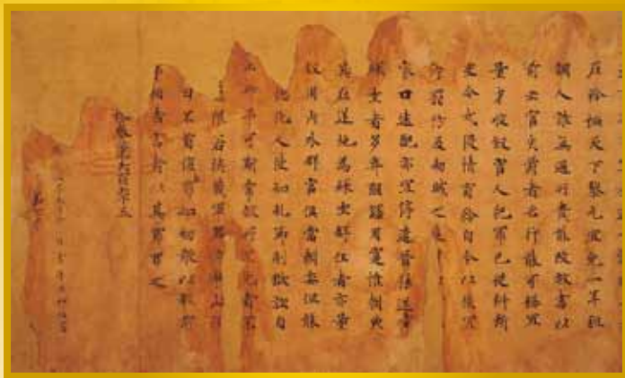
国宝 文館詞林 正智院