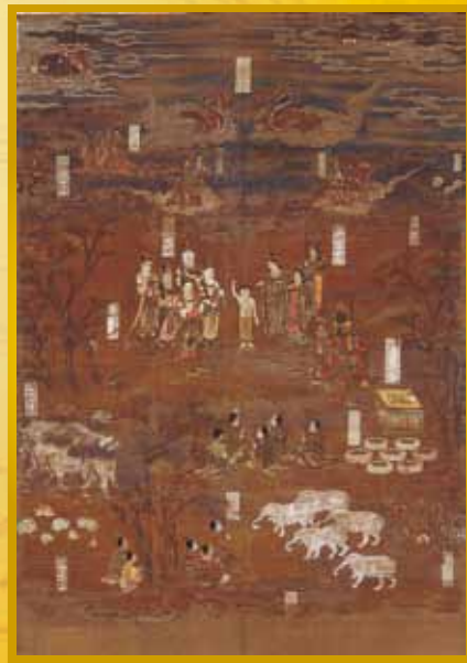
釈迦誕生図 金剛峯寺