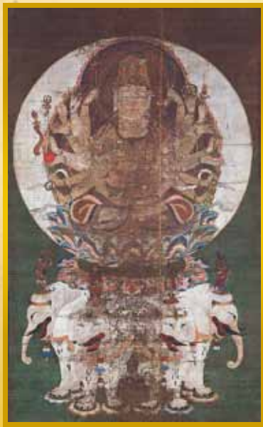
重要文化財 普賢延命菩薩像 正智院【前期展示】