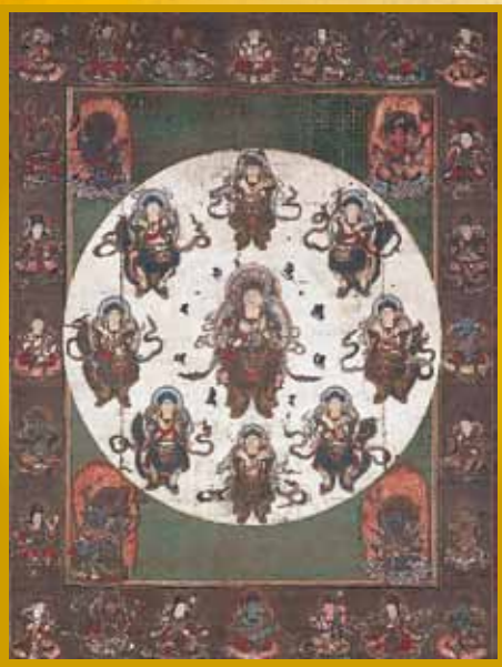
重要文化財 八字文殊曼荼羅図 正智院【後期展示】