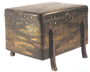
さわちどりらでんまきえこからびつ 国宝 沢千鳥螺鈿時絵小唐櫃 金剛峯寺 展示期間:8/26~9/23