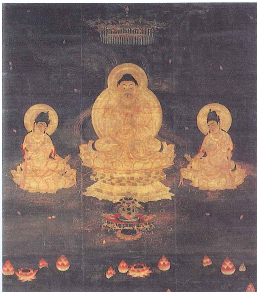
あみださんぞう 国宝 阿弥陀三尊像 蓮花三昧院