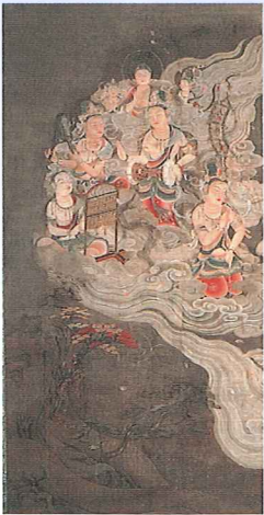
あみだしょうじゅうらいごうず 国宝 阿弥陀聖衆来迎図 有志八幡講十八箇院 展示期間:7/13~8/25