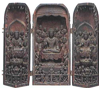
しょそんぶつがん 国宝 諸尊仏龕 金剛峯寺