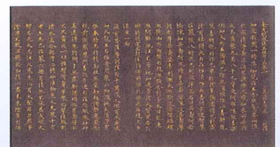
ししきんじこんこうみょうさいししようおつきよう 国宝 紫紙金字金光明最勝王经 竜光院