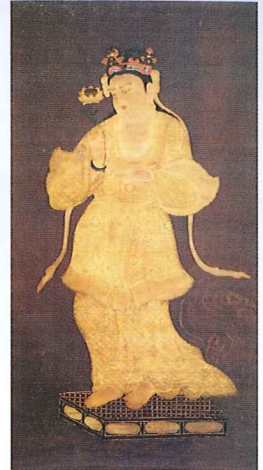
でんせんちゅうゆうげんかんのんぞう 国宝 伝船中湧現観音像 竜光院 展示期間:7/13~8/25