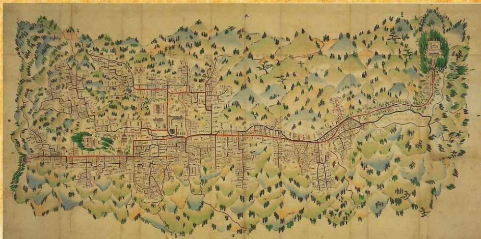
高野山絵図(万治元年本(1658)) 金剛峯寺 【通期】