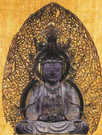
宝冠釈迦如来像 金剛峯寺 【通期】