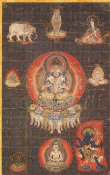
重文 一字金輪曼荼羅図 遍照光院 【後期】