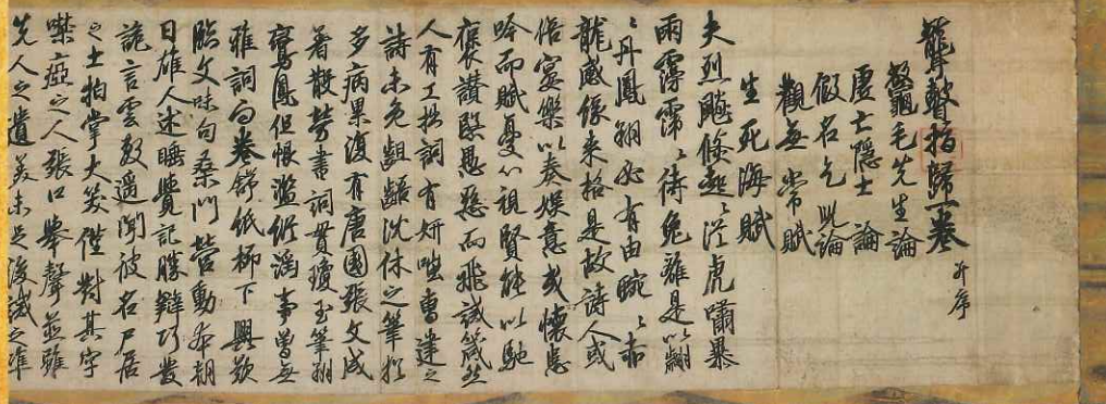
国宝 龍聲指帰(上巻) 金剛峯寺 【期間限定】