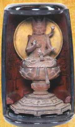
筒型厨子入愛染明王小像 金剛峯寺 【通期】