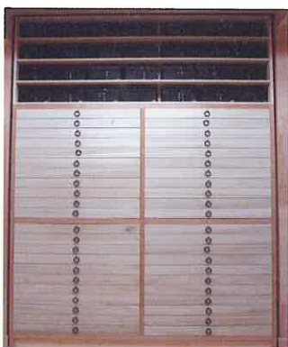
新たに制作した経巻を納める全44段のタンス。上部には黒漆塗箱を収蔵。