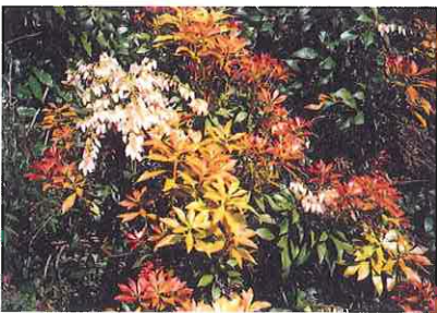
萌えでる新葉と残花

山の朱褐色の蕾みをつけはじめます。冬の間に徐徐に膨らみ、春の諸法会が執り行われる頃、法会にともなう妙音や訪れる人達の軽やかな足音、明るい談笑などに覚醒したかのように、蕾みがスズランに似た形の白い花となります。花群れに騒々しさがなく静やかです。