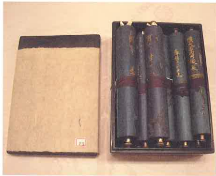
黒漆塗箱に経巻を納めていた従来の状況 箱寸法：縦32.5cm 横22.8cm 高11.5cm

本経は中尊寺経とも呼ばれ、藤原清衡の発願となり、永久五年（一一一七）から八、九年の歳月をかけて書写されたものです。本経の特長は何と言っても、紺紙に金字と銀字に