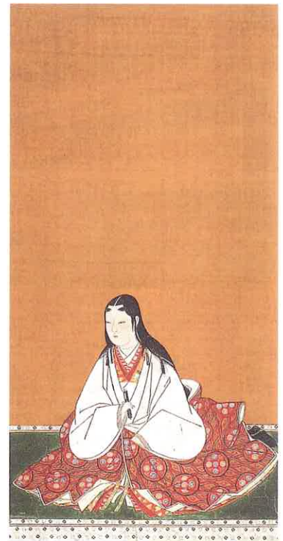
浅井長政夫人像 持明院 (「江〜姫たちの戦国〜」展貸出)