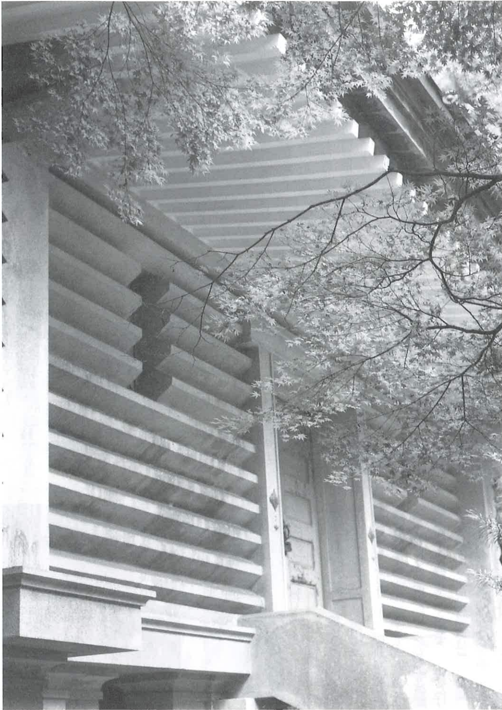
「宝の蔵 心の色」(霊宝館小宝蔵)

平成23年2月10日発行 和歌山県伊都郡高野町高野山306 （財）高野山文化財保存会 高野山霊宝館 電話0736-56-2029