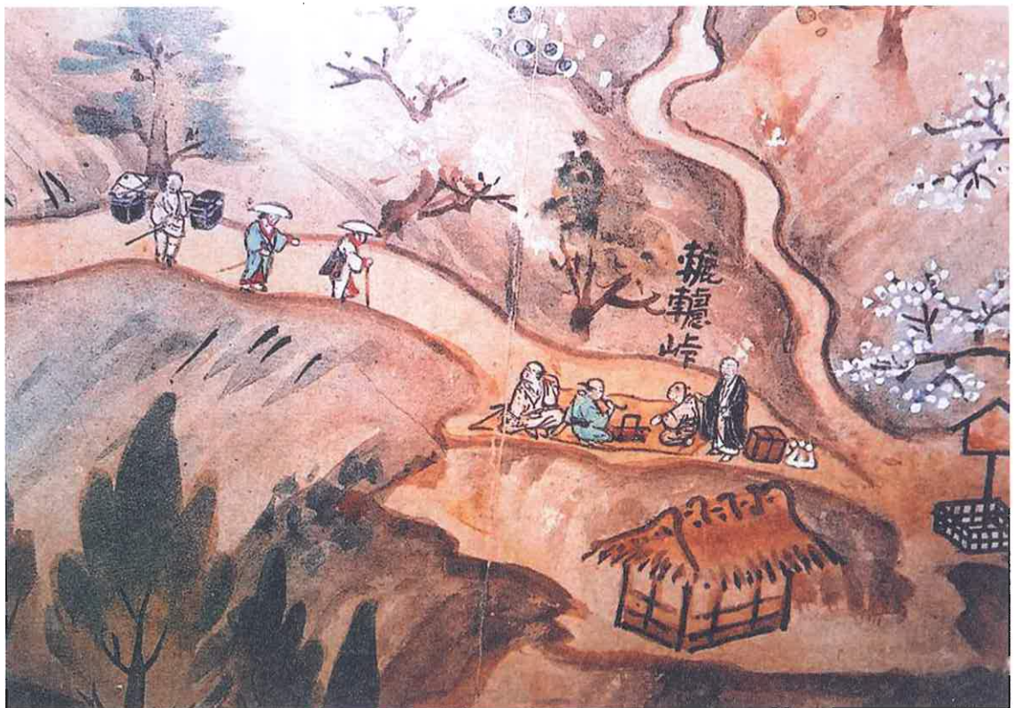
写真2 高野山絵図 西南院蔵 轆轤峠に参る女性参詣人。荷物持を従えている。別に、酒宴を行っている男性達もいる。ここでは酒を飲むことも許された。女人堂と思われる建物もある。