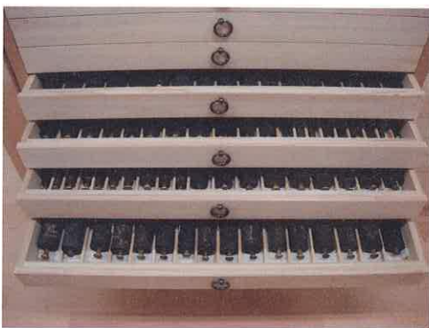
各経典を1巻ずつ並べるのに移動型仕切り板を設ける ことで解決しました。