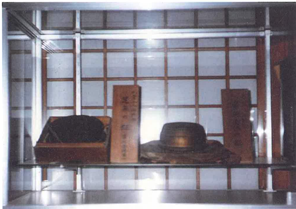
写真1 向かって左、荻萱上人所持の「足無の鉦」 向かって右、石童丸所持の「常行念佛の鉦」と西光寺では伝えている