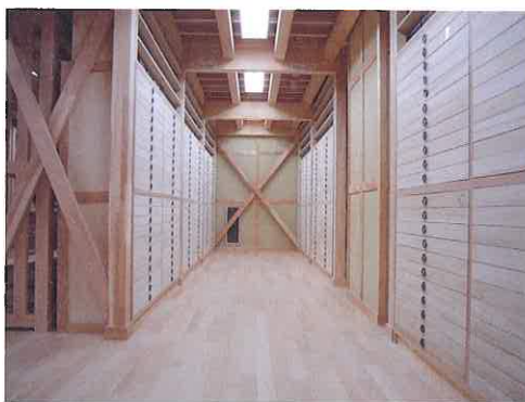
タンス1棹に約750巻の経典が収蔵されています。 合計5棹を制作しました。