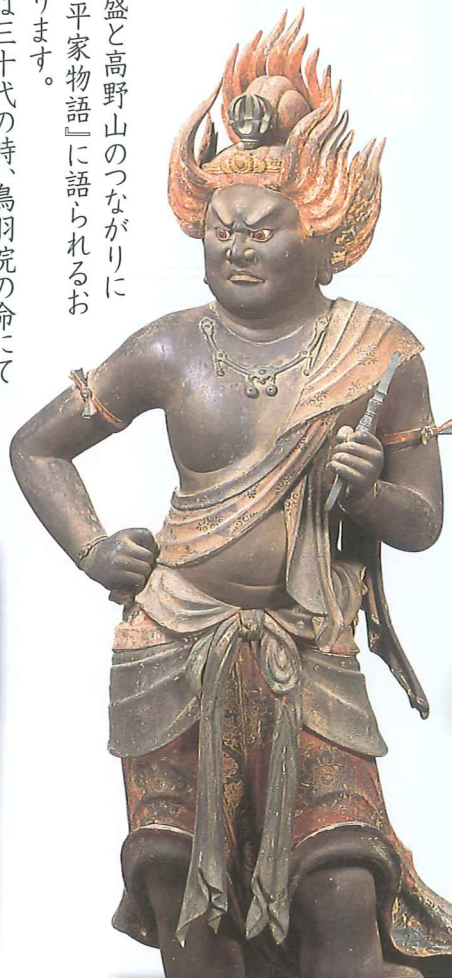
国宝 鳥俱婆迦童子像