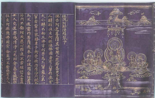
重要文化財 紙紮金字一切経(荒川経)

この展覧会では「血曼荼羅」を中心に、清盛の周辺人物ゆかりの品や、清盛の時代の仏像や絵画を展示します。白河院、鳥羽院、後白河院などの参詣記録がある清盛時代の高野山を感じてください。