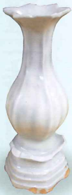
重要文化財 奥之院出土物