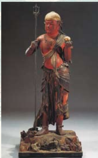
女院の願いを込めた童子