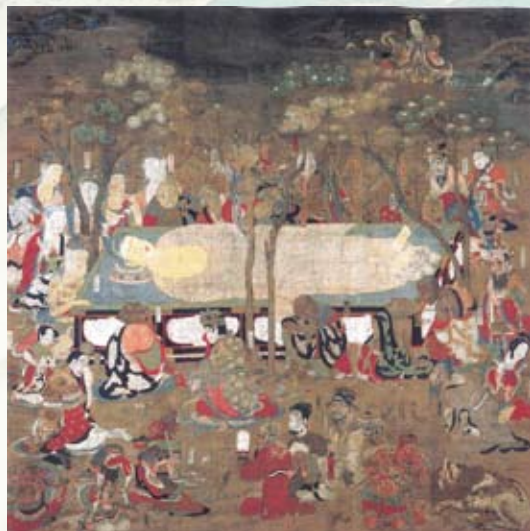
我が子の為に舞い降りる母

時に歴史の表舞台に立ち、また、精神的支えとして女性が果たしてきた役割は、高野山においても決して小さいものではなかったと思われます。展示を通して女性のパワーを断片的にでも感じ取っていただけたら幸いです。