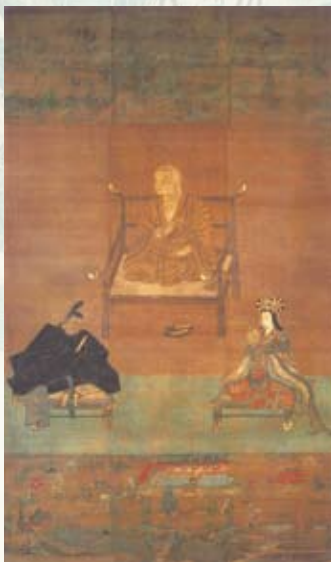
高野山を護りし女性神